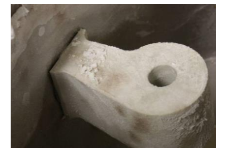
Induktiver Leitfähigkeits-sensor ILFS 02: trotz Oberflächen-Verschmutzung immer ein exaktes Dosierergebnis

Mit fast den gleichen Funktionen ausgestattet ist der größere Bruder Concept 2106mcs . Mit einer Förderleistung von 500 ml/min und 40% ED kann er an Maschinentypen mit einem maximalen Produktverbrauch bis zu 12 Liter pro Stunde eingesetzt werden. Besonderheit beim Concept 2105mcs und Concept 2106 mcs ist die exakte Rotordrehzahlregelung (GCL-Technologie) . Diese sorgt dafür, dass auch bei Druckschwankungen etc. immer der eingestellte Wert eingehalten wird. In der Betriebsart „ einstellbare Förderleistung (grob/fein) “ erfolgt mit dem Concept 2105mcs dadurch eine präzise Dosierung von Klarspüler in Druckkreisläufe.